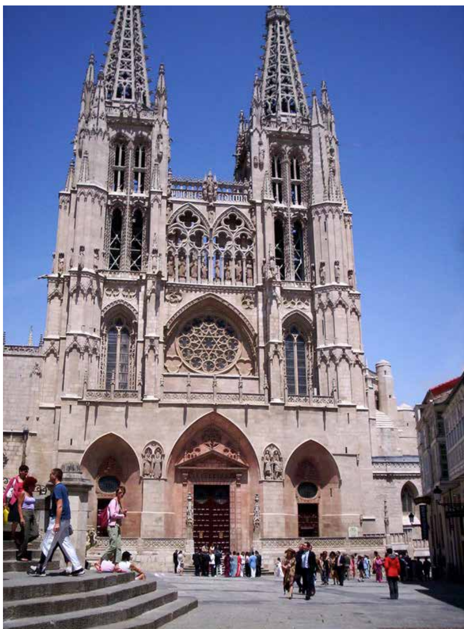
Burgos Cathédrale 1» photo prise depuis le plaza St Maria

Le balisage nous conduit vers le Paseo del Espolon sur la rive du rio Arlanzon, avec ses alignements de platanes, ses espaces verts et ses massifs floraux. Il