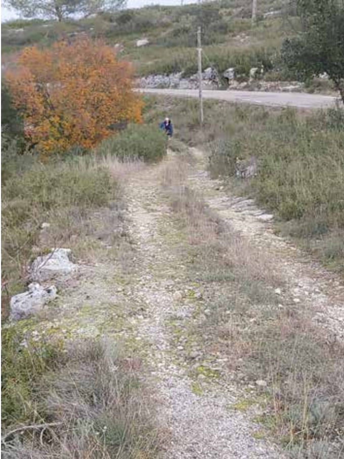
La voie des Helviens, au-dessus à droite la D 418