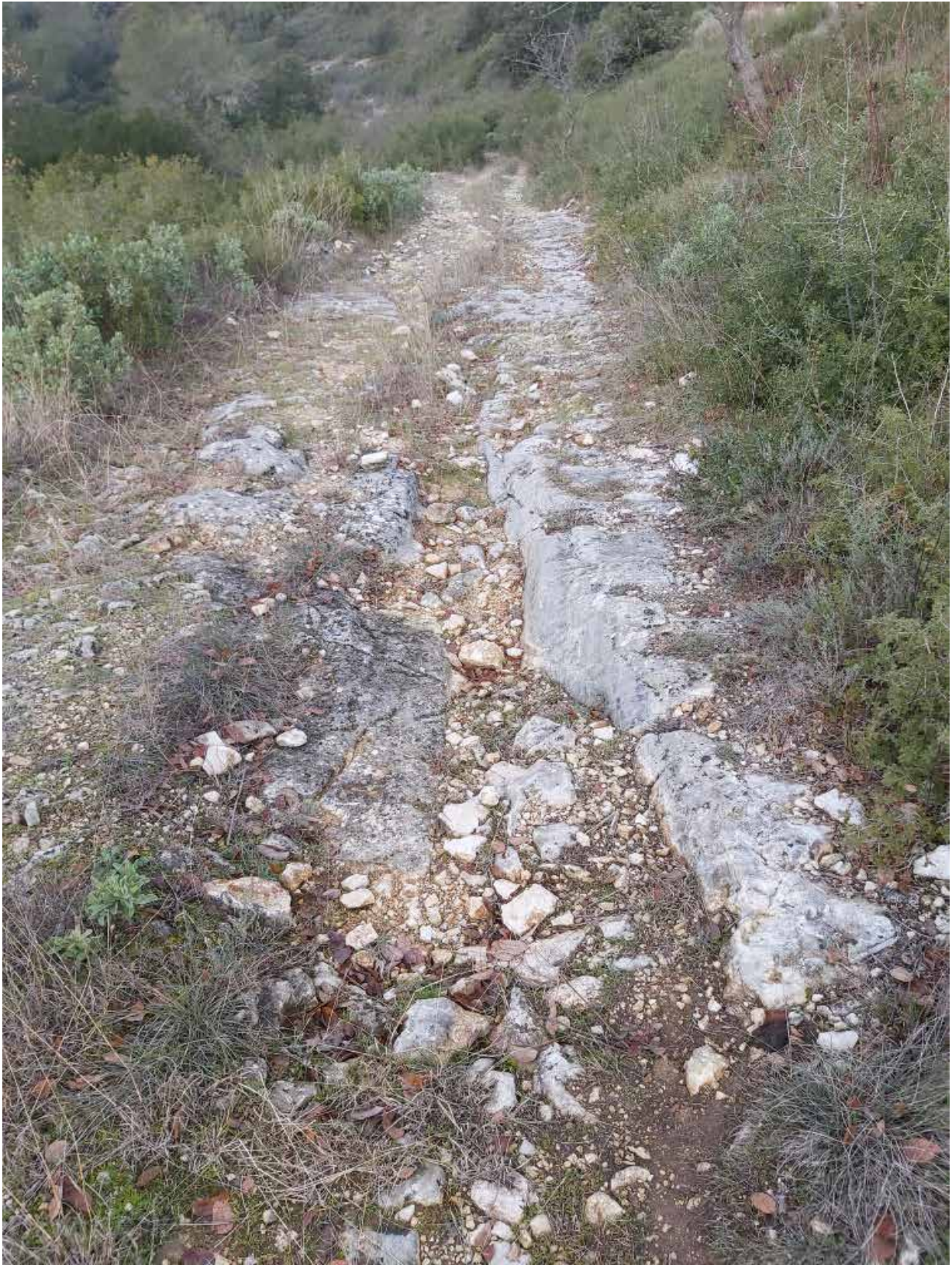
Vestiges de la voie dallée d'Antonin à Sainte-Anastazie ravagée par le déluge de 2014.