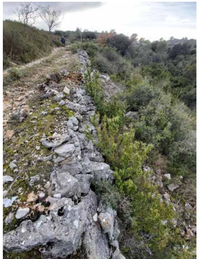
Soutènement de la voie d'Antoninus Le Pieus (138 à 161 apr.JC)

Les Helviens étaient les habitants de l'Helvie, un des nombreux territoires qui constituaient la Gaule, mosaïque de tribus. Il s'étendait sur le sud actuel du département Ardèche. Sa