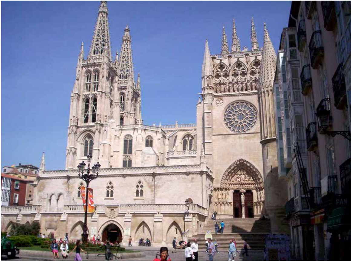
Burgos Cathédrale 2» Photo prise depuis la plaza Rey San Fernando.

n'en fallait pas plus pour changer d'ambiance à l'écart de la circulation, à l'ombre d'arbres remarquables entourés de citoyens désormais moins pressés et ainsi nous réconcilier avec la ville.