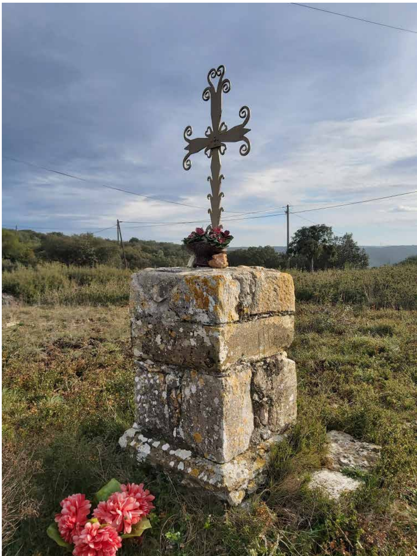
Calvaire sur le col à Castel Viel, voie Antonine, Sainte-Anastazie. Calvaire sur le col à Castel Viel, voie Antonine, Sainte-Anastazie.