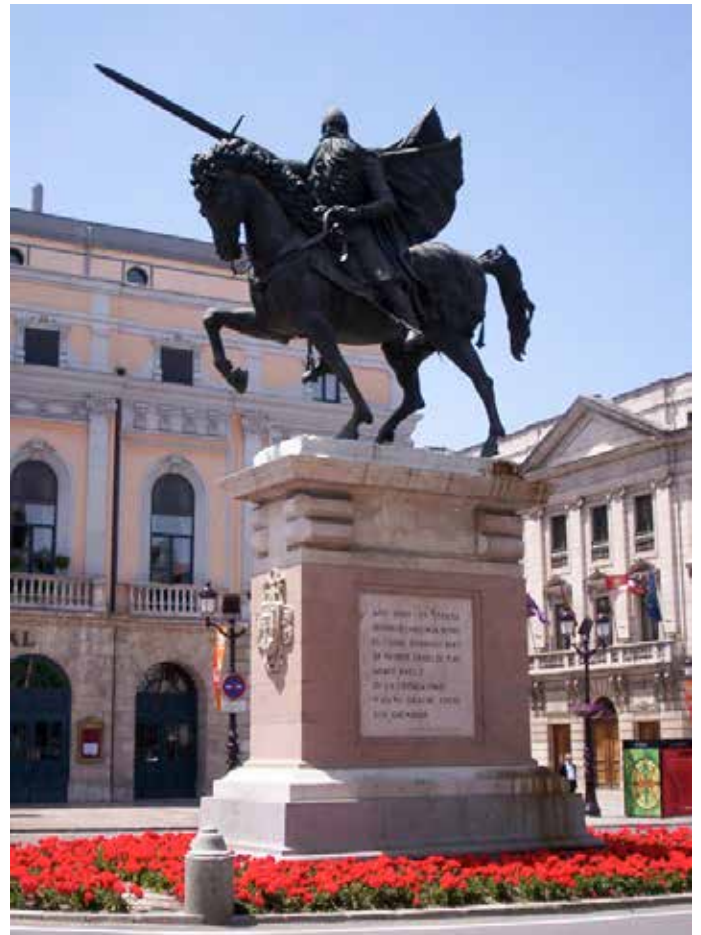
Burgos le CID» photo prise Plaza Mayor